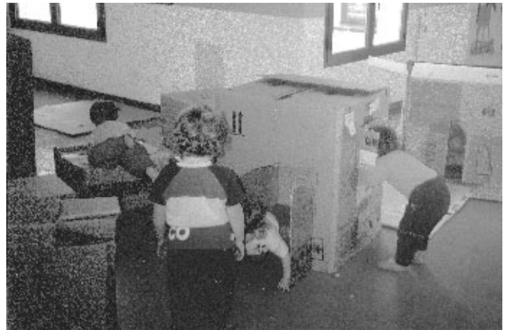
Attività dei bambini nello spazio bimbi

La copertura complessiva a carico del comune è quindi aumentata e questo è un fatto politico rilevante, come rilevante eticamente e politicamente è la progressiva inversione di tendenza che prevede la sostituzione (dove è possibile) del personale a tempo determinato delle società appaltanti con personale assunto dal Comune, avente uguali diritti e lo stesso stipendio.