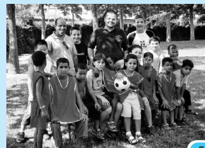
I bambini del Sahrawi ospiti al Campo Robinson