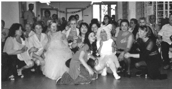
Festa di inaugurazione spazi alla casa di Riposo Francesco Ramponi