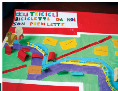
Alcuni plastici realizzati dagli alunni delle classi 4 A e 5 C

Le Insegnanti della Scuola Elementare di San Giorgio di Piano