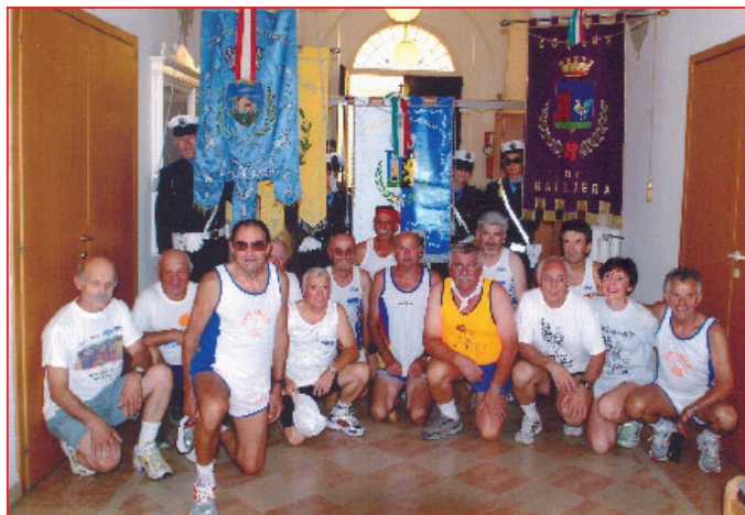
Il gruppo podistico del 1° agosto 2005 all'arrivo a San Giorgio di Piano

Lunedì 1 agosto ha fatto sosta nel nostro Comune la staffetta podistica proveniente da Bibione, Venezia. La staffetta Bibione - Bologna è un appuntamento annuale che si svolge in occasione delle celebrazioni dell'anniversario della strage alla Stazione di Bologna del 2 agosto 1980. È anche questo un modo per ricordare un tragico avvenimento che ha colpito duramente la nostra città e l'Italia intera, una strage dove hanno perso la vita 85 persone e altre 200 sono rimaste ferite. Quest'anno si è celebrato il 25° anniversario della strage, e nonostante sia ormai trascorso un quarto di secolo, della strage sono stati individuati e condannati gli esecutori ma non ancora i mandanti. Nel breve incontro in Municipio, è stato espresso il ringraziamento della comunità di San Giorgio agli organizzatori e partecipanti alla staffetta, che poi ha proseguito il suo percorso verso altre tappe nei Comuni vicini e