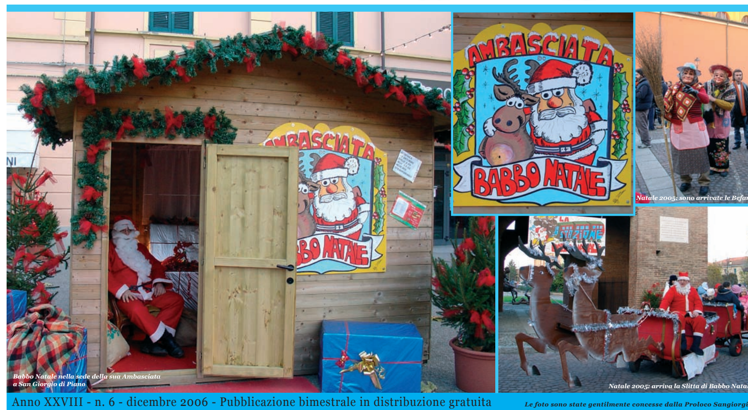
Babbo Natale nella sede della sua Ambasciata a San Giorgio di Piano