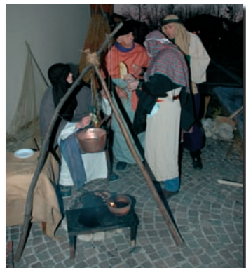
Accampamento di pastori