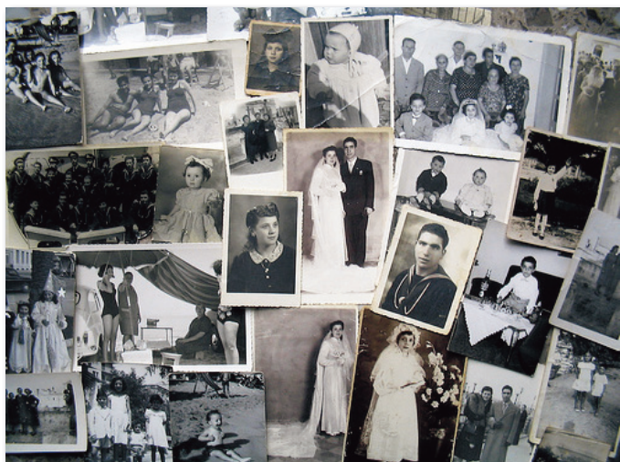
Ricordi di vita

SI RINGRAZIA SENTITAMENTE LA FONDAZIONE DEL MONTE DI BOLOGNA E RAVENNA PER IL CONTRIBUTO DI 20.000 EURO DONATI A SOSTEGNO DEL NOSTRO PROGETTO RIVOLTO AL MIGLIORAMENTO DELLA QUALITA' ABITATIVA DELLA STRUTTURA E GRAZIE AL QUALE E' STATO POSSIBILE IMPLEMENTARE EFFICIENZA ALLA COMPLESSIVA ORGANIZZAZIONE DEI NOSTRI SERVIZI.