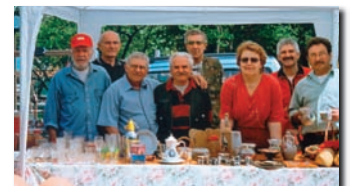
Alcuni volontari del Gruppo AUSER San Giorgio