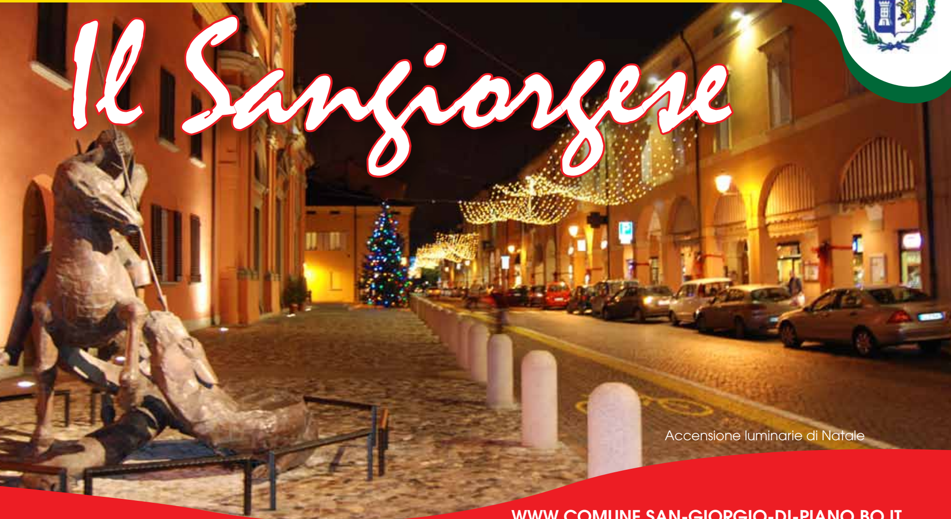
Accensione luminarie di Natale